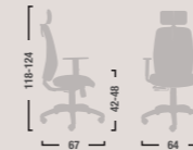
QD20 Poltrona ergonomica alta braccioli regolabili e oscillante mov.4. High ergonomic armchair adjustable with mov.4.