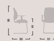
QD24 Sedia fissa con braccioli. Fixed armchair.