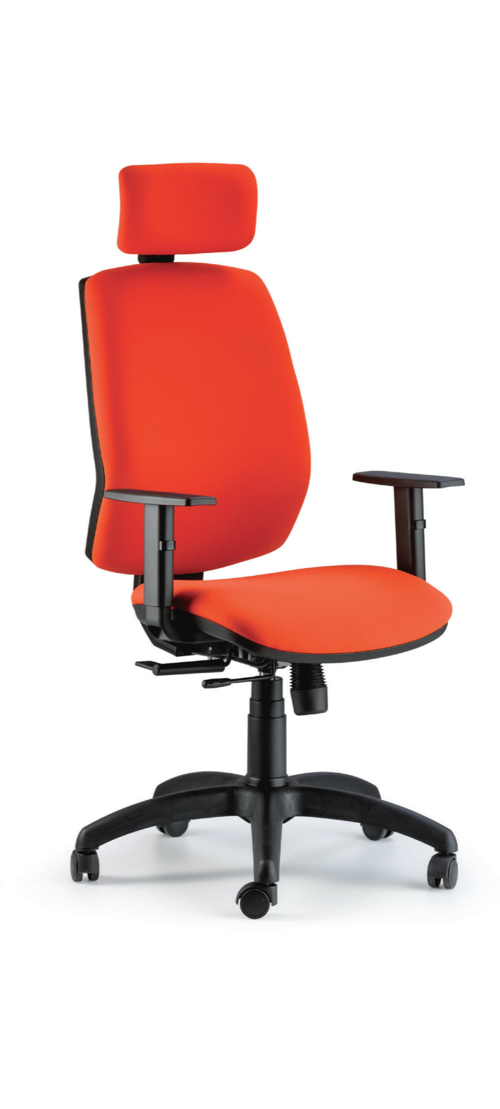
QUID OPERATIVE CHAIR