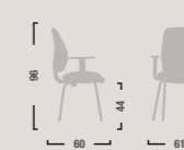
QD26 Sedia fissa con braccioli. Fixed armchair.