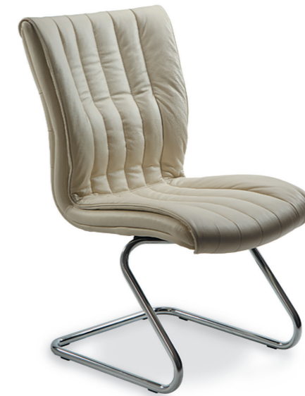
APOLLO EXECUTIVE CHAIR