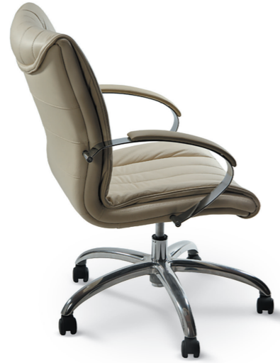
APOLLO EXECUTIVE CHAIR