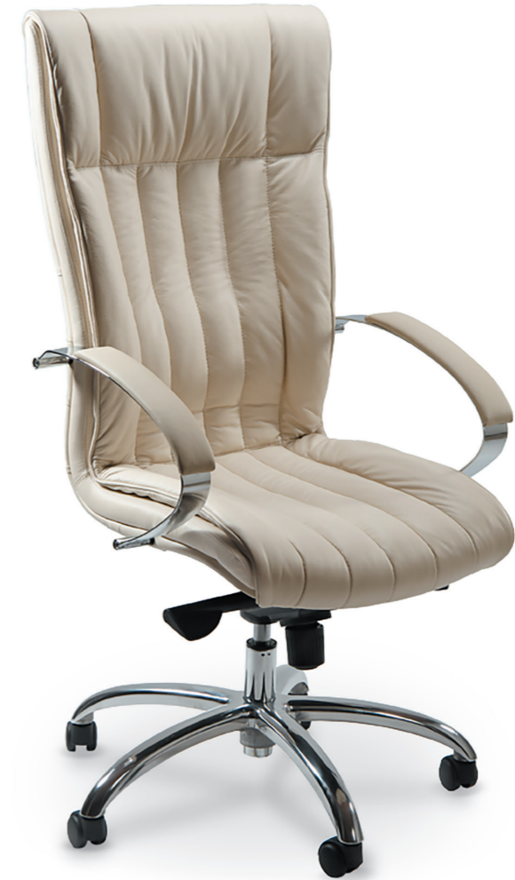
APOLLO EXECUTIVE CHAIR