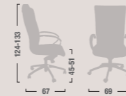
AP 11 Poltrona presidenziale con braccioli e oscillante mov. 3. Presidential armchair with mov.3 tilting.