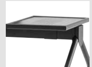
Tavolino Small table