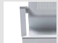
Bracciolo singolo Single armrest