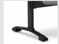
Gamba panca con forma a "T" T-shaped legs