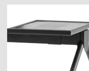
Tavolino Small table