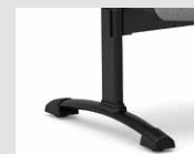
Gamba panca con forma a "T" T-shaped legs