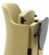
TV Tavoletta scrittoio