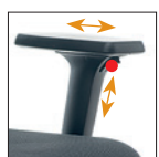
2D Braccioli regol. Altezza-allungabili Adjustable arms Height-Extensible PU Pad