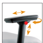
3D Bracciolo regolabile allungabile e orientabile Adjustable extensible and rotating arm PU Pad