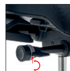
Blocco e sblocco oscillazione (5 posizioni) Tilt movement (5 positions)