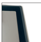
Schienale imbottito, fronte e retro Upholstered back, front and backside