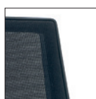
Schienale rete Mesh backrest D218-D219 D220-D221 D222