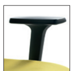
Braccioli fissi nylon Fixed nylon arms