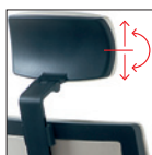
Appoggiatesta regolabile in altezza e orientabile Adjustable and rotating headrest