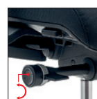
Regolazione rapida intensità oscillazione (1/4 di giro min/max) Tension adjustment (1/4 lever turn, minimum/maximum)