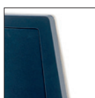
Schienale imbottito, retro nero Upholstered back, black backside