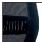
Appoggio lombare regolabile (sch. rete) Lumbar support adjustment (mesh backrest)