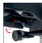
Varia (Solo/only HV) Variatore angolo sedile (0°/-2,5°/-5°) Seat angle adjustment (0°/-2,5°/-5°)