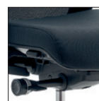
H - HV Meccanismo synchron, regolazione monolevera Synchron mechanism with adjustments on single-lever