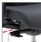
Synchron autoregolante Self-weighting Synchron Blocco e sblocco oscillazione (5 posizioni) Tilt movement (5 positions)