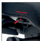
Trasla Regolazione profondità sedile (60 mm) Seat depth adjustment (60 mm)