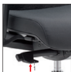
RE Synchron autoregolante Self-weighting Synchron Alzo seduta Seat height adjustment