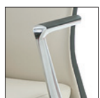
Bracciolo alluminio con soprabracciolo in poliuretano nero Aluminium arm with black polyurethane top PU Pad