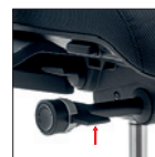
Alzo seduta Seat height adjustment