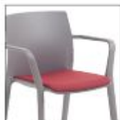
Cuscino sedile fisso Seat fixed cushion