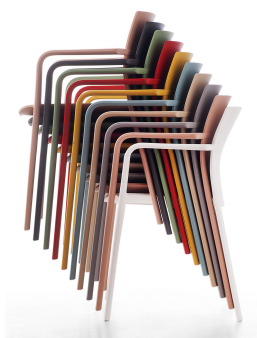
impilabilità versioni in polipropilene (pz. 10) polypropylene version stackability (pcs. 10)