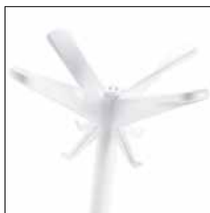
1486-B Bianco lucido