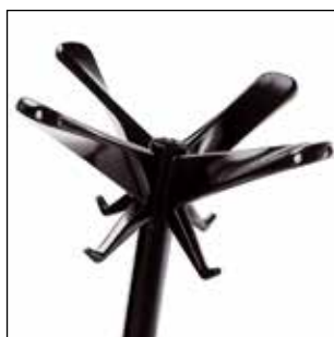
1486-N Nero lucido