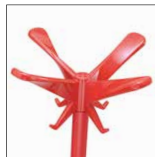
1486-AR Arancione rosso (RAL 2002) lucido