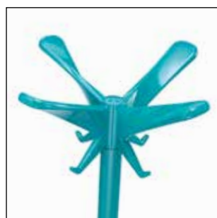
1486-OT Blu acqua (RAL 2002) lucido