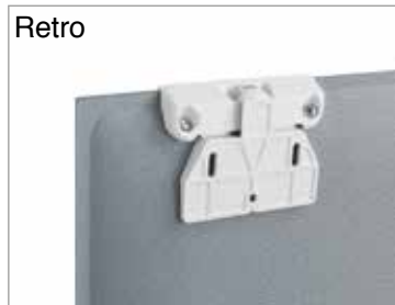
Dettaglio attacco bianco opaco