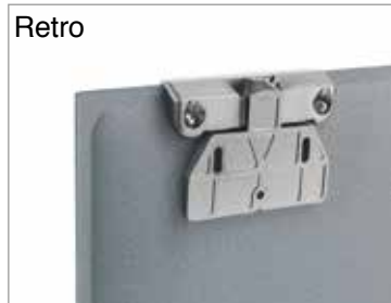
Dettaglio attacco nichel satinato