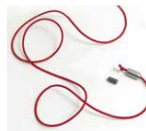
L. 200 cm