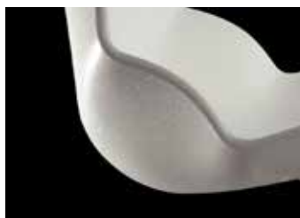
Particolare scocca bianca