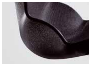
Particolare scocca nera