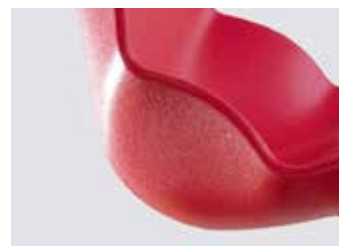
Particolare scocca rossa