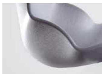
Particolare scocca grigia