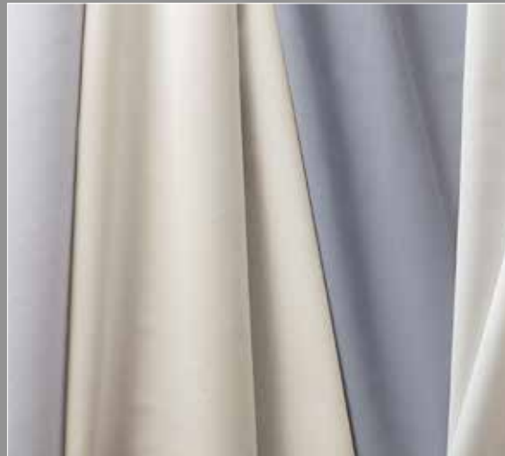
Fiber 2 Line