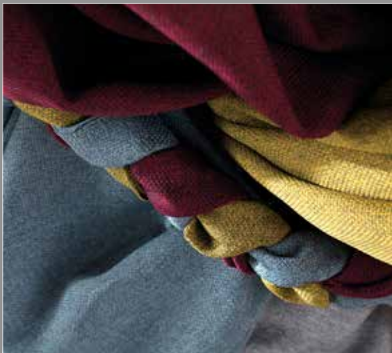
Fiber 3 Melange