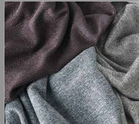
Fiber 8 Bouclè