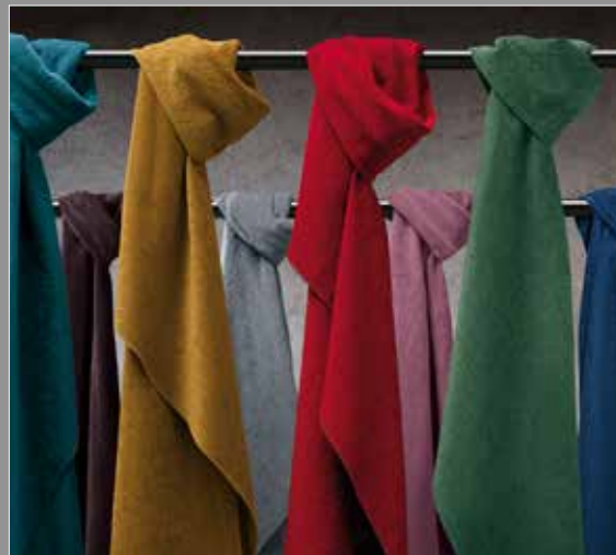
Fiber 6 Velvet