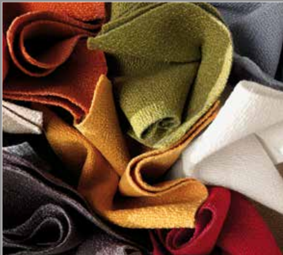
Fiber 1 Color