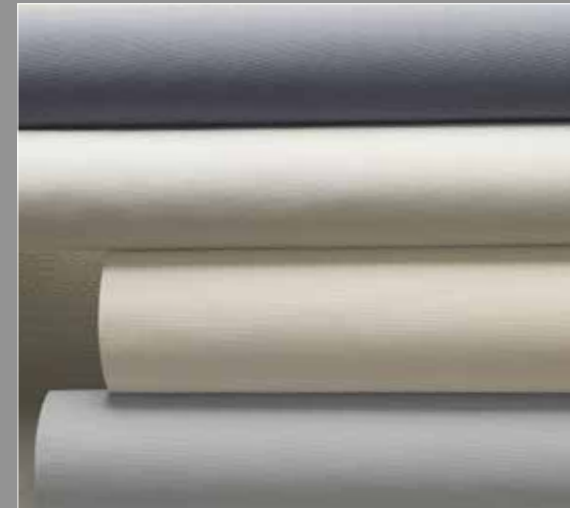
Fiber 2R Line-R